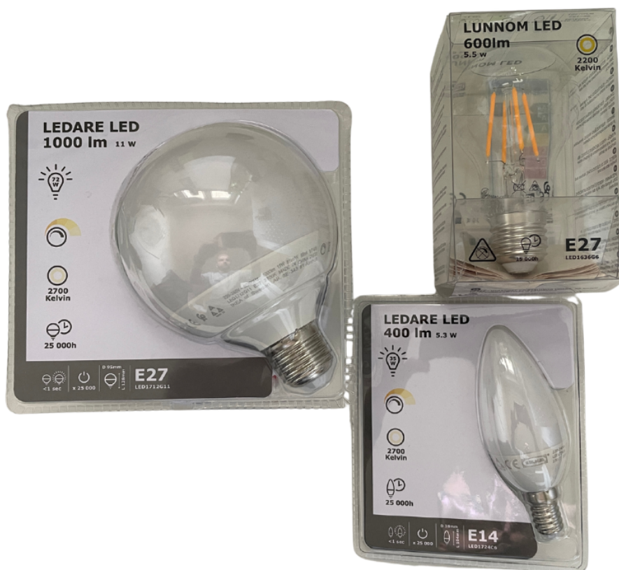
Ilustracja 2. Opakowania żarówek z informacjami, jakiej mocy jest każda żarówka (tj. ile potrzebuje watów do działania).

Jeśli nie możesz znaleźć informacji o mocy bezpośrednio na urządzeniu, spróbuj wyszukać w Internecie. Najlepsze wyniki może dać wyszukiwanie dokładnej nazwy produktu lub numeru modelu wraz z frazą typu „moc watów”. Jeśli nie znasz dokładnej nazwy/numeru modelu produktu, wypróbuj bardziej ogólne wyszukiwanie, np. „moc lodówki w watach”. Wiele stron internetowych zawiera informacje na temat zużycia energii przez popularne urządzenia elektryczne.